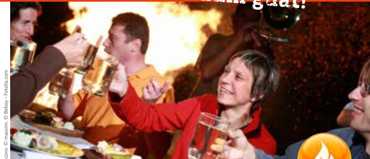
Icons © Maxim, © Beby - Fotolia.com

Die Mitgliedsbetriebe der ARGE Panoramahöhenweg